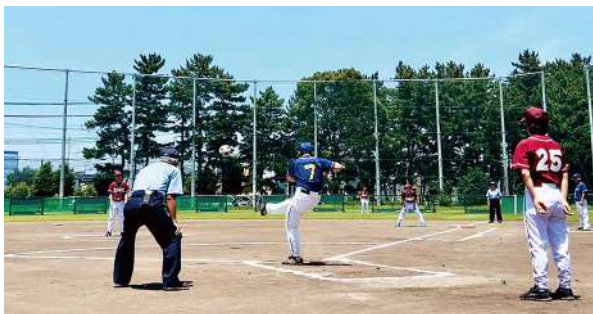
7月7日(日) フットソフトボール(知的) 参加選手数35人 会場 千葉県総合スポーツセンター 軟式野球場・ソフトボール場

今年度を実施した千葉県障害者スポーツ大会(一部競技については前年度大会)において顕著な成績を収めた選手の中から、10月に佐賀県で開催される全国障害者スポーツ大会『SAGA2024』の千葉県代表選手が選考委員会で選ばれました。