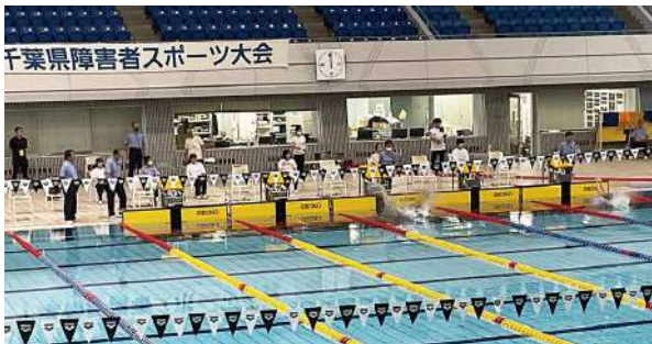
5月19日(日) 水泳競技(知的・身体) 開会式・陸上競技に先駆けて開催しました 参加選手数は86人 会場 千葉県国際総合水泳場 大会新記録は14、タイ記録は1