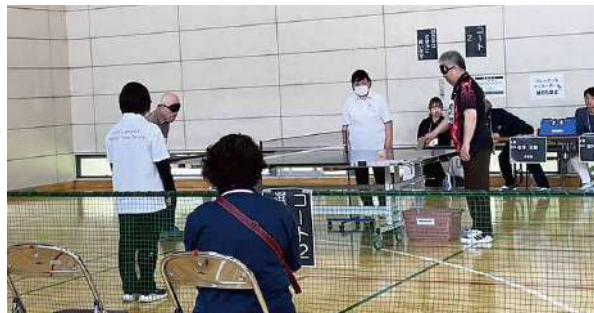
6月1日(土) サウンドテーブルテニス競技(身体) 参加選手数29人 会場 千葉県障害者スポーツ・レクリエーションセンター