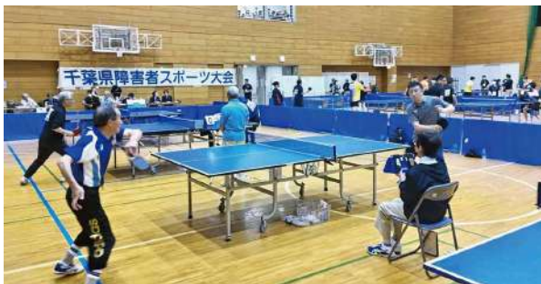
6月2日(日) 卓球競技(知的・身体・精神) 参加選手数144人 会場 花島公園スポーツ施設体育館