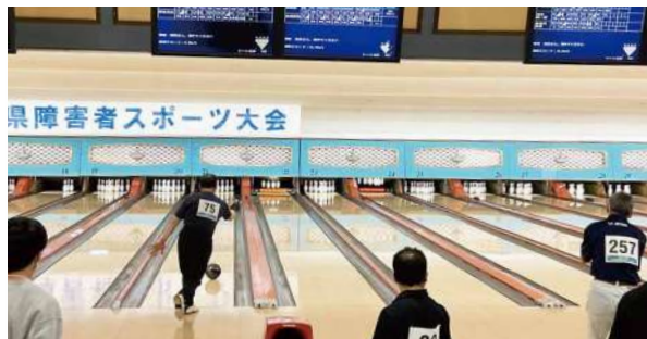
6月2日(日) ボウリング競技(知的) 参加選手75人 会場 アサヒボウリングセンター